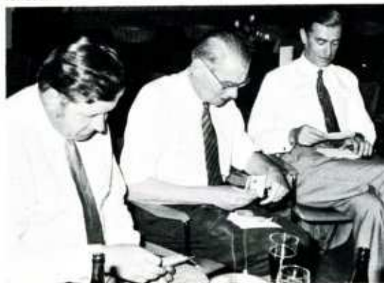
Verheugde gezichten bij de drie vertegenwoordigers van de fondsen.