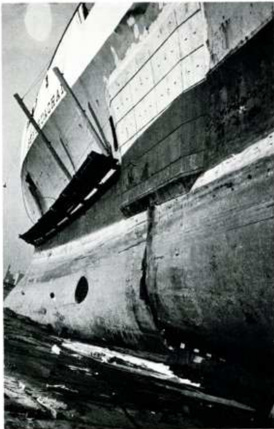
In Durban was een noodreparatie uitgevoerd, hetgeen op deze foto goed zichtbaar is. Onder de waterlijn waren de scheuren echter nog goed waarneembaar.

Evenals indertijd met de reparatie van het Britse passagiersschip Carmania werden ettelijke voorbereidende besprekingen gevoerd met zoveel mogelijk betrokkenen op de werf, teneinde het karwei zelf zo efficiënt en soepel mogelijk te doen verlopen.