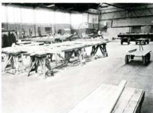
Kijkjes in de nieuwe werkplaats van de afdeling Houtbewerking op de NW.

Op het moment dat wij dit stukje schrijven wordt bij de NW de laatste hand gelegd aan een nieuwe werkruimte voor een eveneens nieuwe afdeling. De vroegere afdelingen van de houten scheepsmakers, de timmerlieden en de modelmakers zijn onlangs namelijk samengevoegd tot de afdeling Houtbewerking.